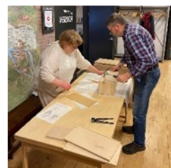
T.h. Besök hos Föreningen Bruksongar 2023-01-31

Från och med 2023 tar vi inte emot bokföringsmaterial som är nyare än åtta år. Som vanligt vill vi att ni hör av er innan leverans.