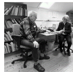
T.v. Arbetsdag Kvarnbygatan 12 2022-01-28