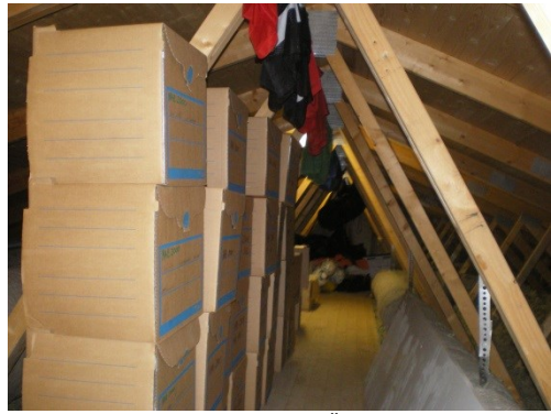
Arkivinventering hos Nimbus Öckerö Missionsförsamling 2014-09-29.