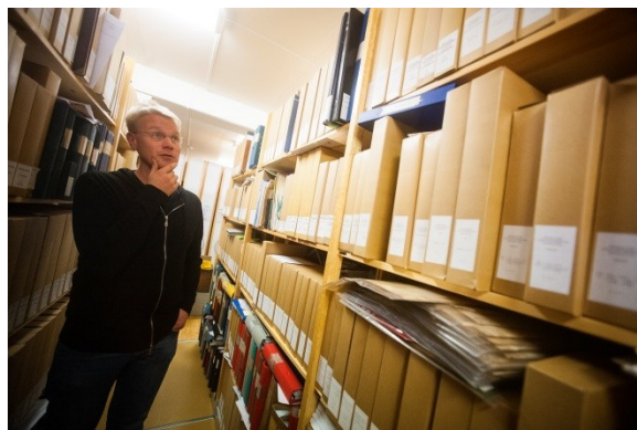
Arkivchefen grubblar.