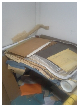
Interiörbild från Ritningsarkivet våren 2015.