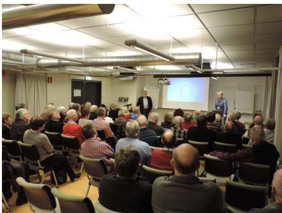
Veteraner från SOAB 2014-02-27.

Vi har även publicerat ett antal av våra bildspel på vår Youtubekanal med god respons