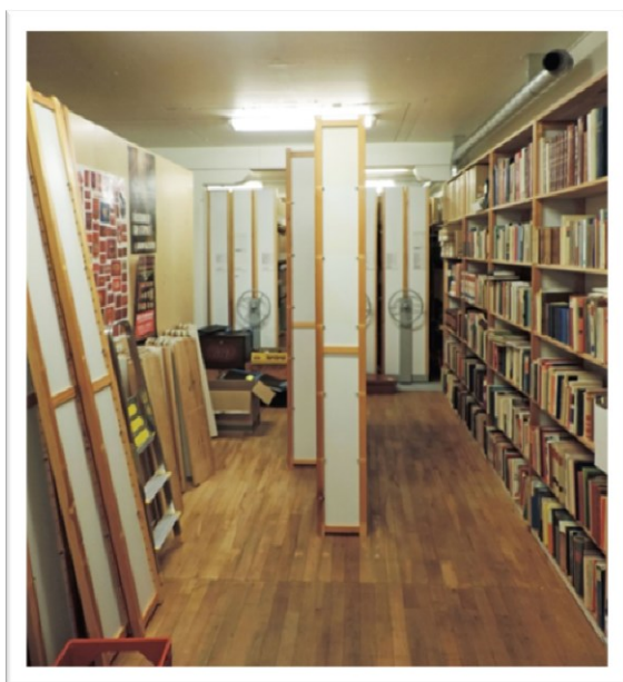
Montering av arkivhyllor 2014-01-27.