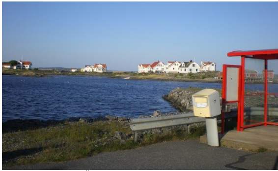
Besök hos Rörö Ö-råd 2014-05-28