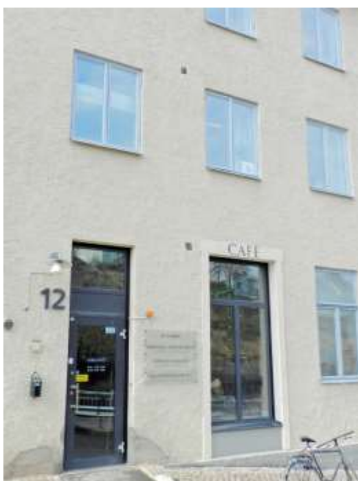
Exteriörbild Expeditionen 14/4 203.