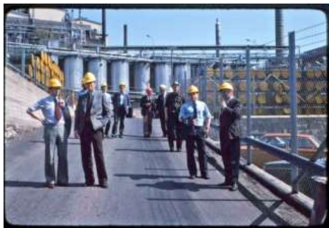
Nyfikna besökare på SOAB år 1976.