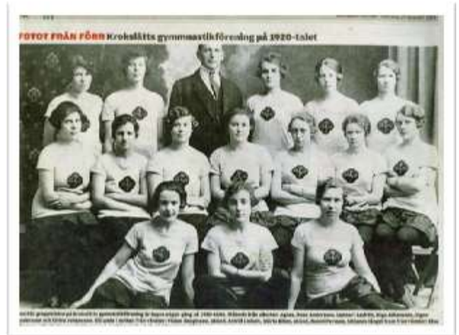
Krokslätts Gymnastikförening på 1920-talet.