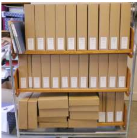
En vagn full nyförtecknat arkivmaterial från Härryda.