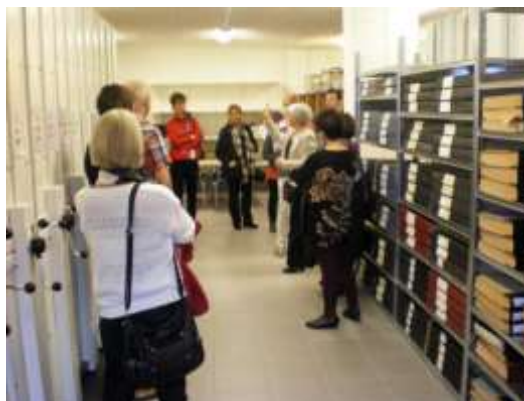
Demonstration av Skaraborgs föreningsarkivs nya lokaler i samband med invigningen 27/5.