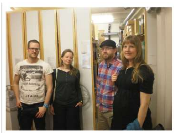
Personal från Folkrörelsernas arkiv och Karl Bjernestad i Arkivdepå 1..