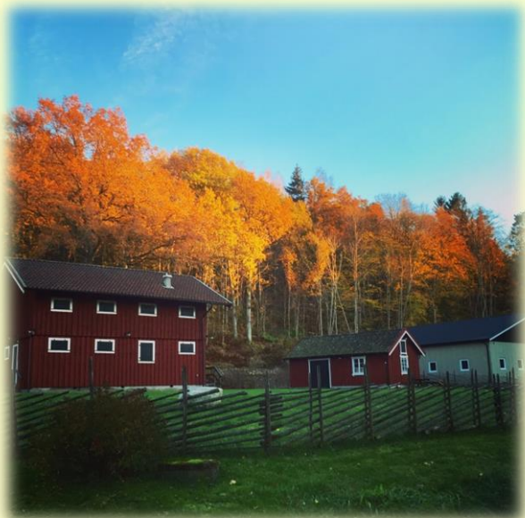
Skepplanda Hembygdsgård.