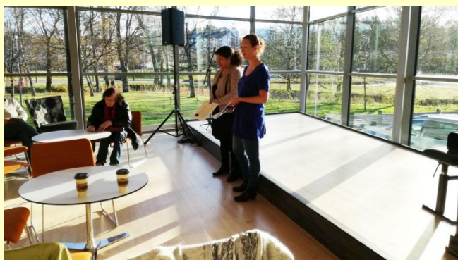
Majblommekommittén i Mölnlycke, Arkivens dag