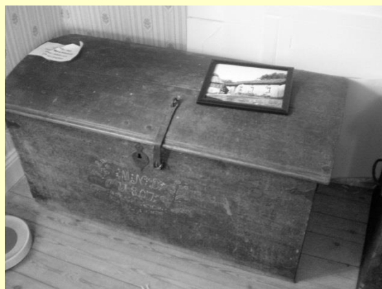
Kista på Långåker