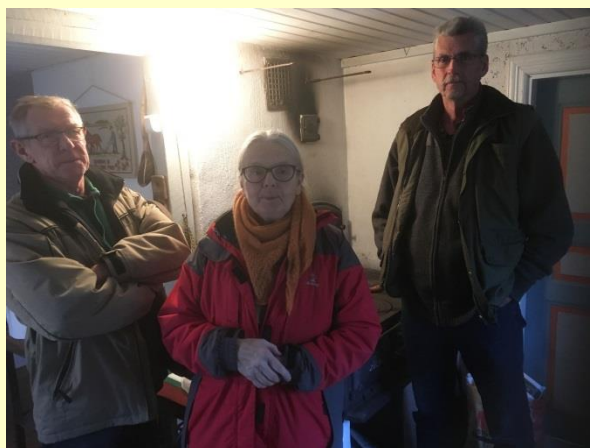
Besök hos Hålanda hembygdsgård

Arkivens dag firade vi på Mölnlycke Kulturhus lördagen 11/11 under rubriken "Synd och skam". Det blev ett lyckat arrangemang trots fyra eller fem strömavbrott. Dagen arrangerades i samarbete med Härryda kommunarkiv, som uppskattade att få möjligheten att komma ut och möta medborgarna. De ca 50 besökarna fick ta del av skärmställningar, titta på film och lyssna på anförande från Majblommekommittén i Mölnlycke, Hela Människan Ria i Mölndal och arkivchefen Jonas Andersson som talade om arkivfrågor. 23/11 medverkade vi också vid invigningen av Föreningsnavet och Fritidbanken i Mölnlycke för att dagen därpå inventera arkiv hos Pixbo Gymnastikförening.